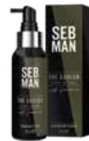
THE COOLER ERFRISCHENDES LEAVE-IN TONIC