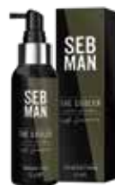
THE GROOM PFLEGEÖL FÜR HAARE UND BART