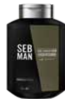
THE SMOOTHER FEUCHTIGKEITS- SPENDENDER CONDITIONER